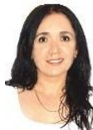
Carmen Miranda Caimanque