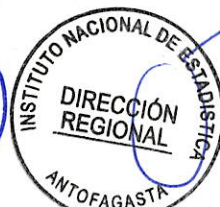
GONZALO IBÁÑEZ ZAMBRA DIRECTOR REGIONAL INSTITUTO NACIONAL DE ESTADÍSTICAS REGION DE ANTOFAGASTA